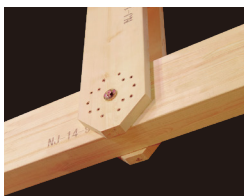
トラスの接合や方杖補強に「MPねじ接合システム」