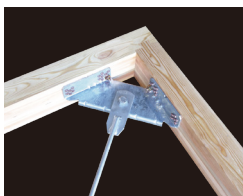
高強度な水平構面を構成「MPブレースシート」