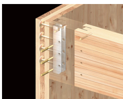
CLT壁パネルと集成梁の接合に「プレセッター SU梁受金物」